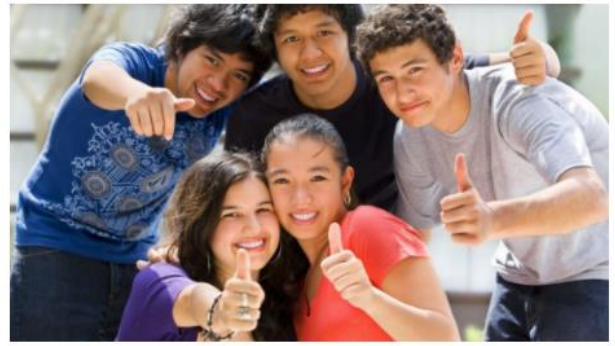
La Maison d'accueil Hejmo Belgique