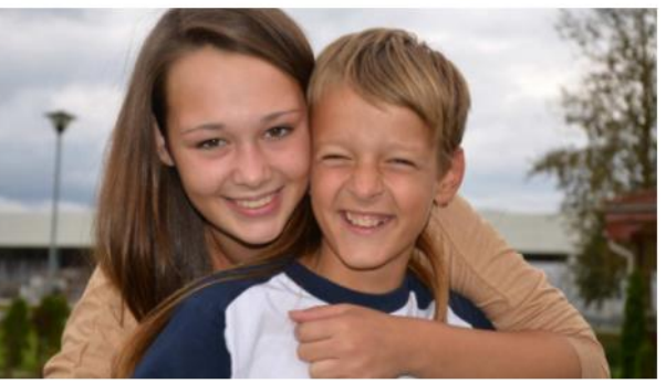
Gardons les frères et sœurs ensemble lors des placements Plaidoyer en Belgique