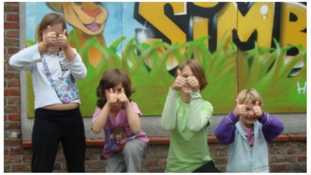
Les Maisons Simba Belgique

https://www.sos-villages-enfants.be/projets