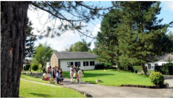
Le Village d'Enfants SOS Chantevent Belgique