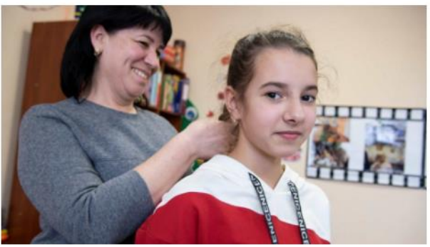
Proximité professionnelle : prendre soin des jeunes avec amour Plaidoyer en Belgique