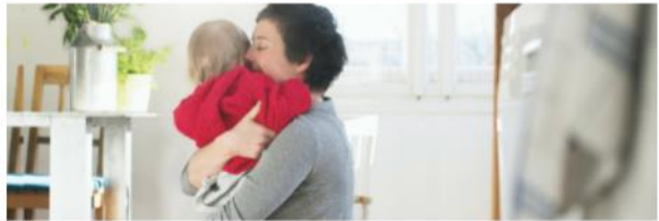
L'introduction des parents d'accueil professionnels dans l'Aide à la jeunesse Plaidoyer en Belgique